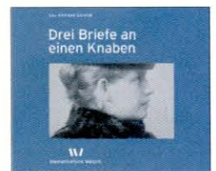
Digitale Ästhetik: Die Erzählung »Drei Briefe an einen Knaben« in der E-Book-Version

Die Inhalte der beiden Originalausgaben sowie weitere Sekundärtexte lagen im XML-Format vor. Die Studierenden hatten sich nicht nur durch einen Dschungel von Software-Problemen zu kämpfen,